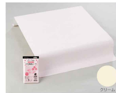
ソフト防水シート(ピンク)