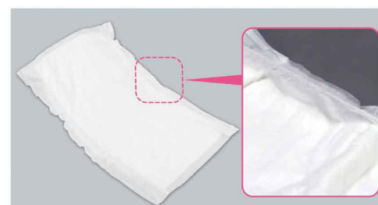
オールマットギャザー付