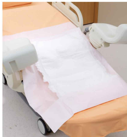
グッドシーツピンクSギャザー付の使用イメージ