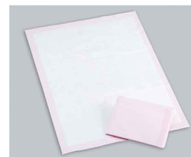
マタニティマット