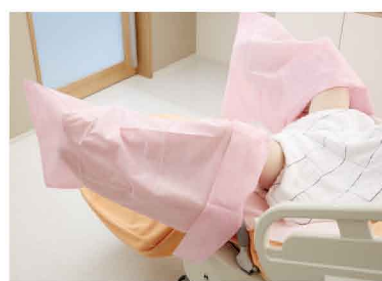
SMS脚袋ピンクLの使用イメージ